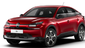
Rouge Elixir met.