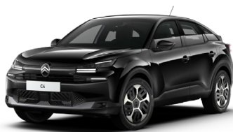
Noir Perla nera met.