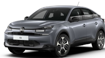
Gris Mercure met..