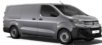
MOF4 | Acier Gray (metalliväri)