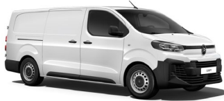
POPR | Ice White (perusväri)