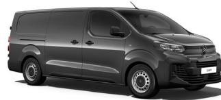
M01J | Titane Gray (metalliväri)