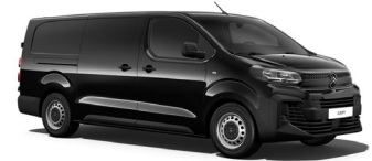
M09V | Perla Nera Black (metalliväri)