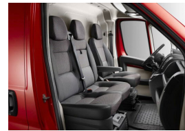
BUFY | Darko kangasverhoilu