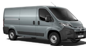
P02B | Thunder Gray (pastelliväri)