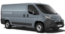
MOZW | Fer Gray (metalliväri)