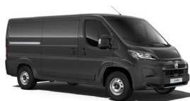
M0E9 | Graphito Gray (metalliväri)