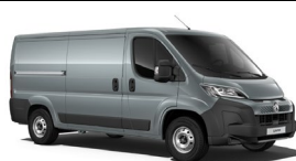
P02B | Thunder Gray (pastelliväri)