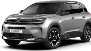
Gris Acier – M0F4 (M)