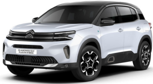
Blanc Okenite – M0SU (P) (M)