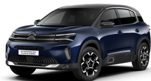
Bleu Eclipse – M06L (M)