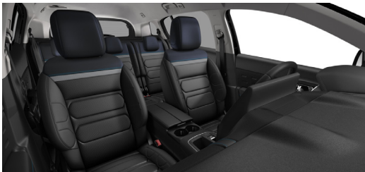
Hype Black – U0FO

P = perusväri H = helmiäisväri M = metalliväri