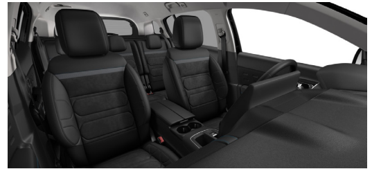
Urban Black – 0JFD