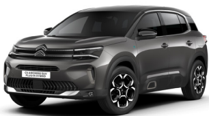
Gris Platinum – M0VL (M)