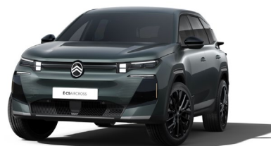
Vert Astoria met.