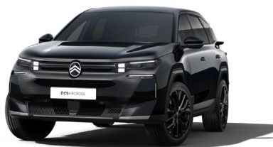
Noir Perla nera met.