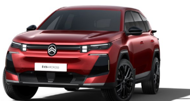
Rouge Rubi met.