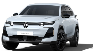
Blanc Okenite met.