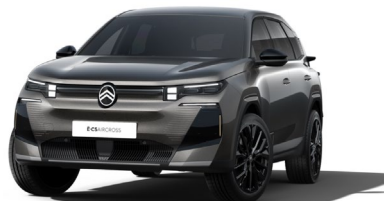
Gris Platimium met