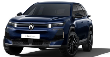
Blue Eclipse met.