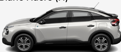
Blanc Nacre (H)*