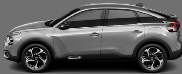
Gris Acier (M)