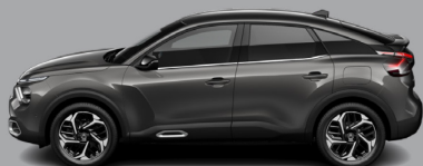
Gris Platinum (M)