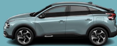
Bleu Olbia (M)*