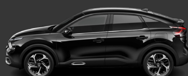
Noir Perla Nera (M)