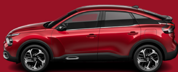
Rouge Elixir (H)