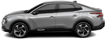
Gris Acier (M)