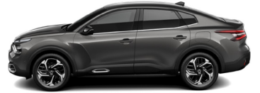
Gris Platinumium (M)