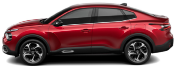
Rouge Elixir (H)