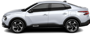
Blanc Okénite (P) (M)