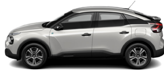
Blanc Nacre (H)*