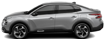
Gris Acier (M)