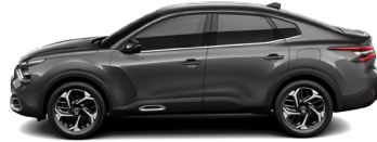
Gris Platinumium (M)