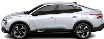
Blanc Okénite (P) (M)