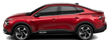
Rouge Elixir (H)