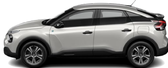
Blanc Nacre (H)*