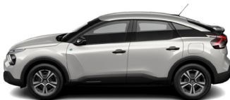
Blanc Nacre (H)*