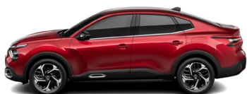
Rouge Elixir (H)