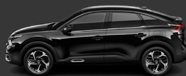
Noir Perla Nera (M)