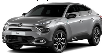
Gris Acier (M)