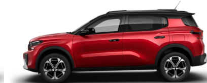
Rouge Elixir met.