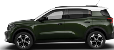
Vert Montana met.