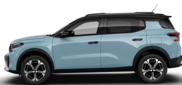
Blue Monte Carlo