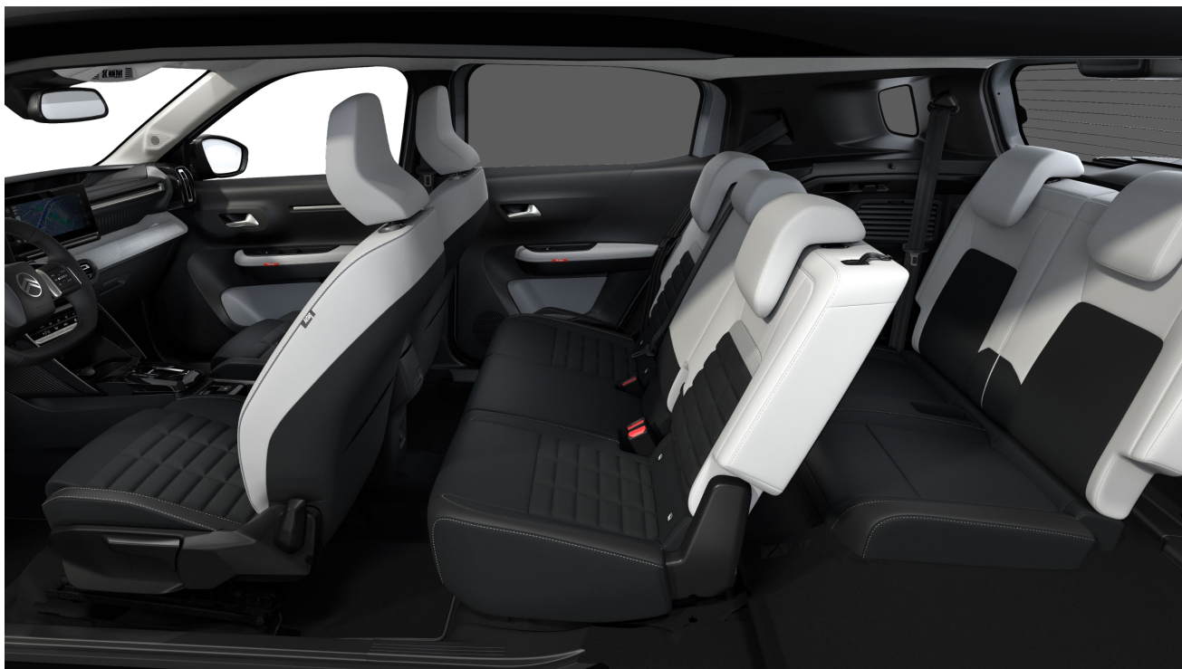
C3 Aircross 7-paikkaisena

* Sähköauton lisävarusteista ei peritä autoveroa. Autovero alkaen on laskettu mallisarjan pienimmällä CO2 arvolla, joka on 12,1 g/km