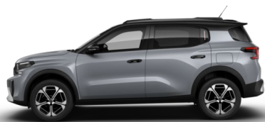
Gris Mercure met.