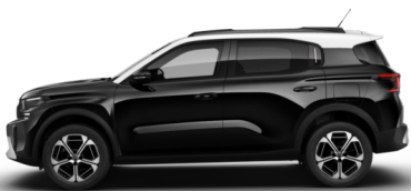
Noir Perla nera met.