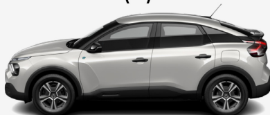
Blanc Nacre (H)*